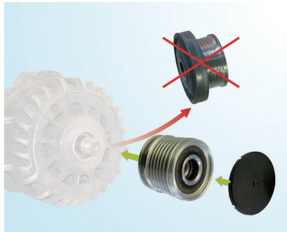
図 3 : 交換の概要